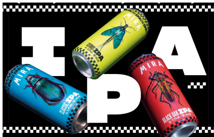
Gamme IPA 44cl

C'est en septembre 2017 que la brasserie Mira brasse ses premières bières à l'eau de source et c'est en décembre 2017 que le Pub Mira ouvre ses portes avec son premier concert en live et sa première exposition de Streetart.